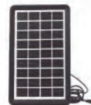
Panel solar 9V/3W