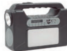
Kit de emergencia