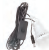
3 Ampolletas 6V/3W